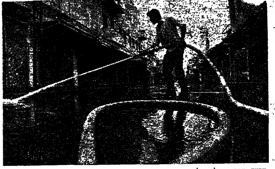
בבנין המבנה החדש... (Caption describing the construction work shown in the image.)